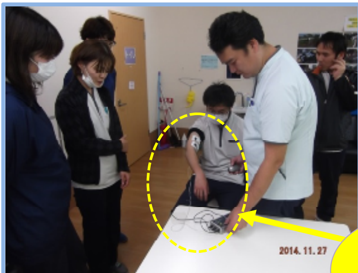
説明の後は実際に機器に触れ、使い方を確認しました。