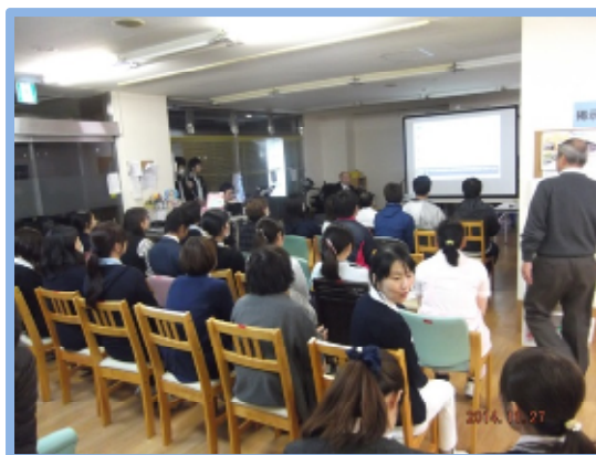
研修会は府内クリニック職員が参加しました。